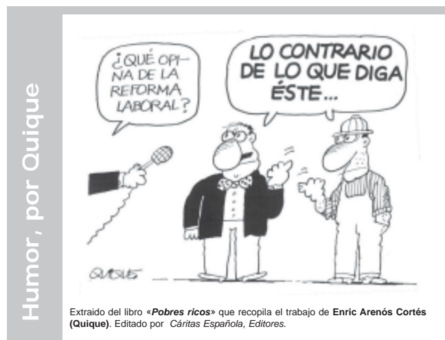
Extraído del libro «Pobres ricos» que recopila el trabajo de Enric Arenós Cortés (Quique). Editado por Cáritas Española, Editores.